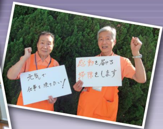
介護助手として働くシニアのみなさん